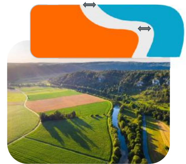
Einfaches Einhalten von Abstandsaufgaben